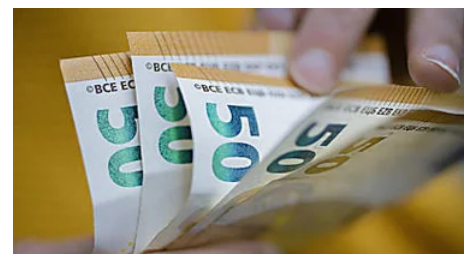
BARGELDFANS WITTERN KOMPLOTT